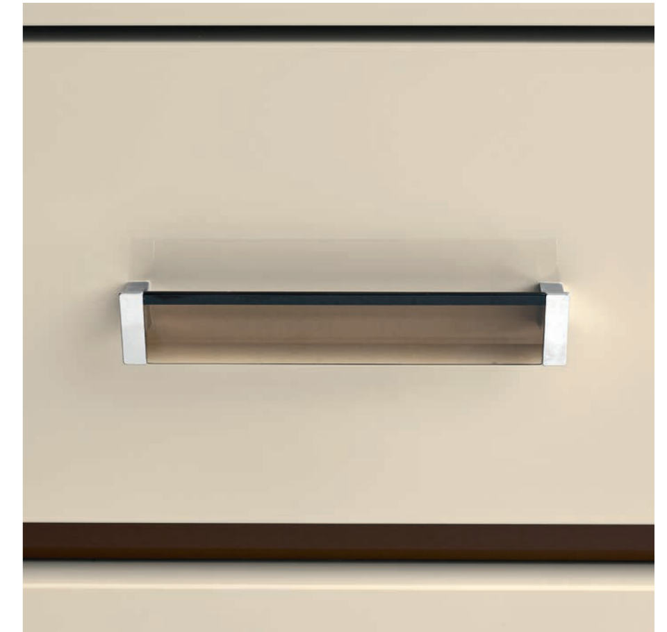
— Maniglia Milano Supporti in acciaio cromato lucido con inserto in metacrilato trasparente finitura fume'.

— Ручка "Fibbia" Ручка из хромированной глянцевой стали.