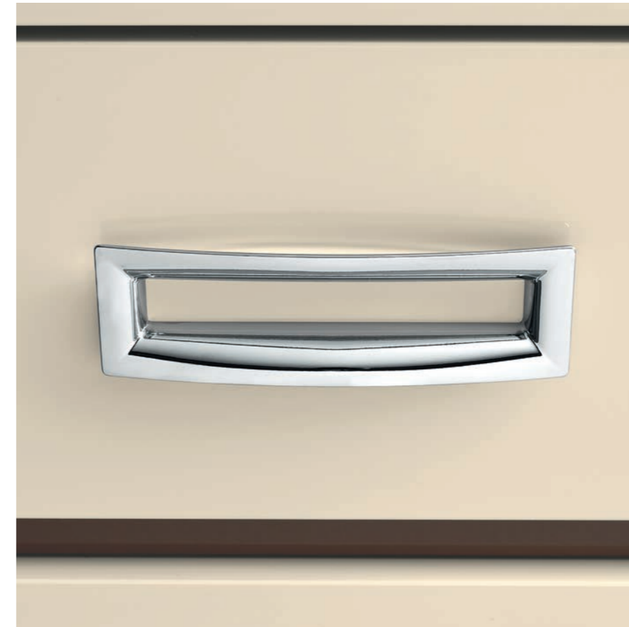
— Maniglia Fibbia Maniglia in acciaio cromato lucido.

— Ручка-кулон из кожи "Cuoio" Ручка-кулон из кожи "Cuoio" ручного изготовления и стальными держателями.