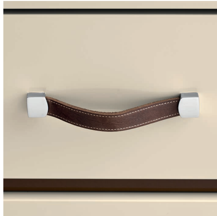
— Maniglia Cuoio Maniglia in cuoio cucita a mano con supporti laterali in acciaio cromato lucido.

— Leather handle Hand crafted leather handle with chromed steel supports.