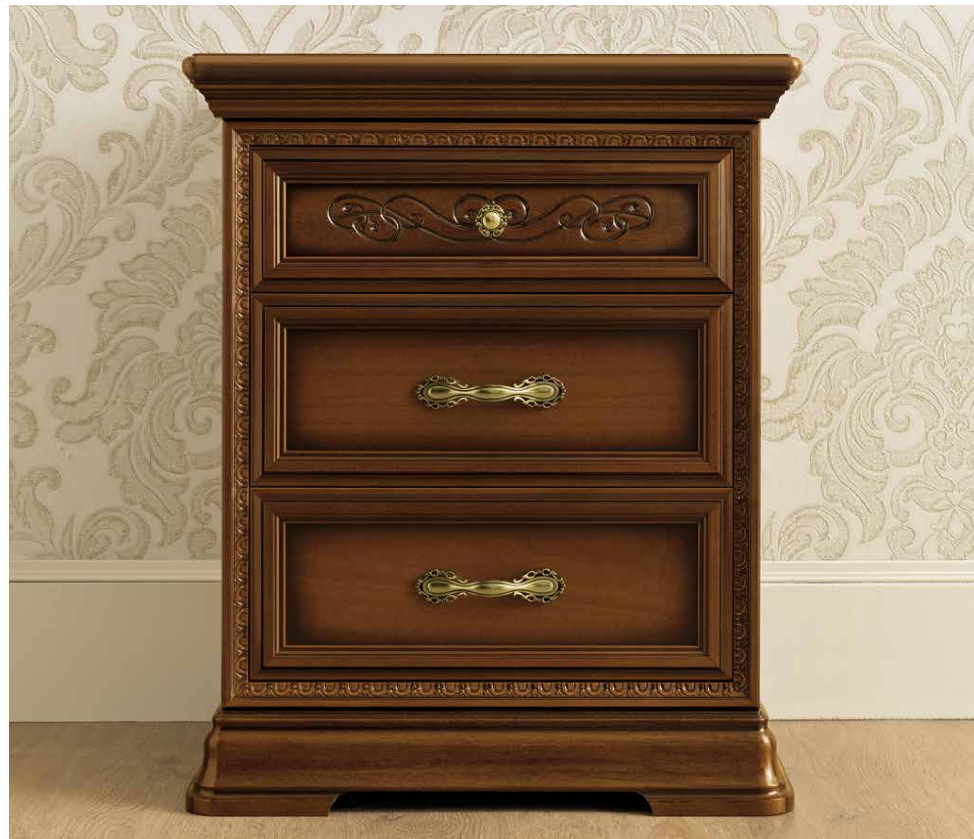
Primo cassetto con nuovo intaglio. First drawer with new carving. Верхний ящик с новой резьбой.